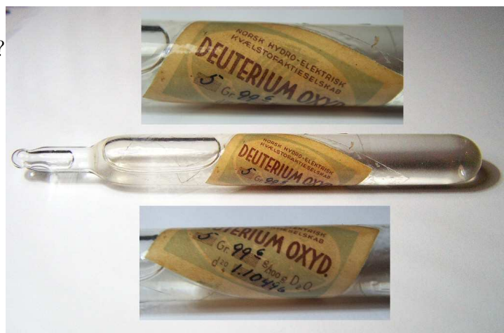
FIGURE 1 – Échantillon d'eau lourde fabriqué par NORSK HYDRO, photographie © Alchemist-hp.

Le premier échantillon d'eau lourde a été isolé par le physicien Gilbert LEWIS en 1933 puis une production industrielle par électrolyse a été mise en pratique par l'entreprise norvégienne NORSK HYDRO de 1934 à 1943.